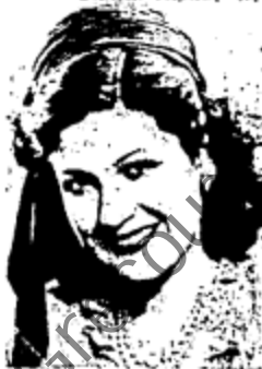
İNΤΙΖΙ ΡΑΡΜΑΚ (Μίς Τουρκία)