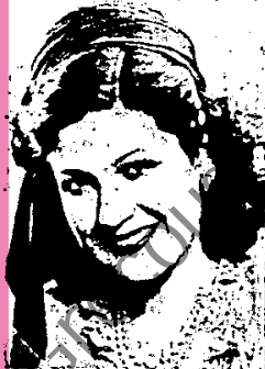
INTZI PARMAK (Μίς Τουρκία)