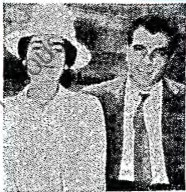
Μαρινέλλα — Καζαντζίδης

Στις παραστάσεις τῆς «Ὀμορφῆς πό- λης» πού συνεχίζονται στο «Πάρκ» θά εμφανισθοῦν ἀπὸ τὴν προσεχῆ ἑβδομάδα οἱ λαϊκοὶ τραγουδισταὶ Στ. Καζαντζίδης